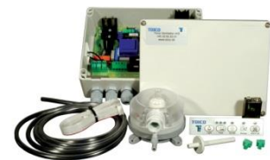
Varenr. 90.041 Motorstyring med 3 trins, for TK 500-40.11 Betjeningspanel og indbygget alarm. Med on/off