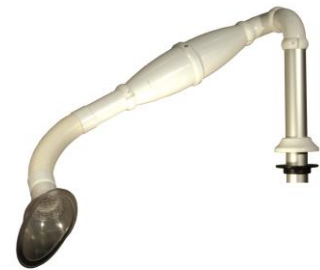
Varenr. 10.01 Flex 45