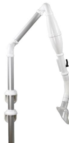
Varenr. 10.123 Multiflex 45