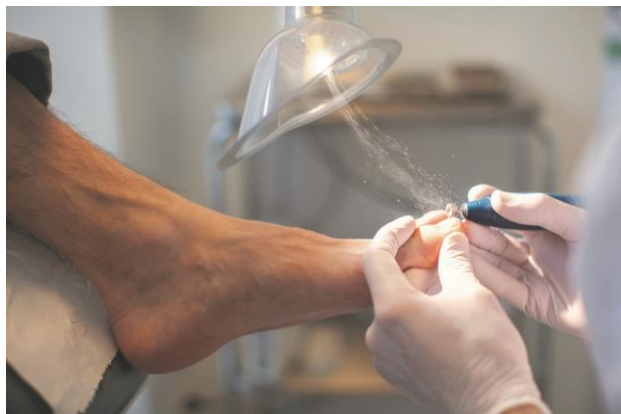
Kilde AT-vejledning Om krav til procesventilation (A.1.1)