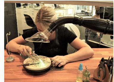
Pjece Få et godt arbejdsmiljø: https://www.danskmatal.dk/Arbejds_miljoe/pjecer/Documents/Pjecer/guld_og_solvsmede.pdf