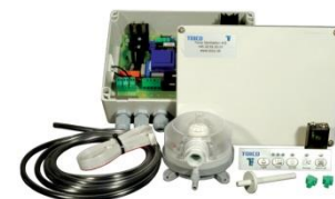
Varenr. 90.041 Motorstyring med 3 trins, for TK 500-40.11 Betjeningspanel og indbygget alarm. Med on/off