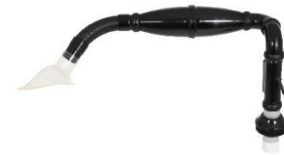
Sugearm for bordmontage Varenr. 10.01