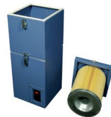
Sugemotor Varenr. 40.11 TK-500