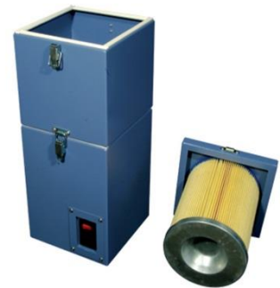
Varenr. 40.11 TK-500