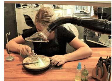
Pjece Få et godt arbejdsmiljø: https://www.danskmetal.dk/Arbejdsmiljoe/pjecer/Document/Pjecer/guld_og_solvsmede.pdf