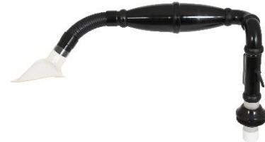
Varenr. 10.01 Flex 45