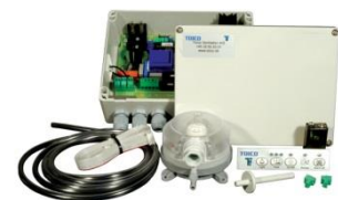
Varenr. 90.041 Motorstyring med 3 trins, for TK 500-40.11 Betjeningspanel og indbygget alarm. Med on/off