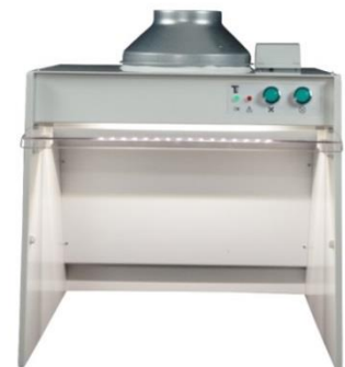
Varenr. 60.071 Limskab og sugemotor, med indbygget lys og trykvaagt