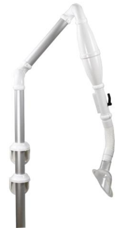
Varenr. 10.123 Multiflex 45