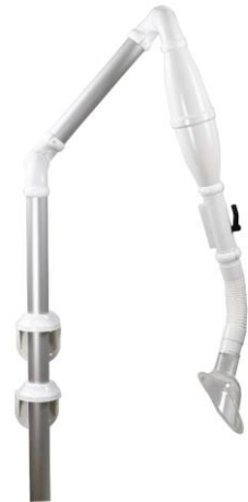
Varenr. 10.123 Multiflex 45

https://at.dk/regler/at-vejledninger/ventilation-faste-arbejdssteder-a-1-1/